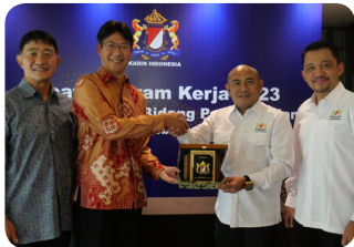
MoU with KADIN (HRD Committee)