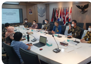
Discussion with DGT (Taxation Committee)