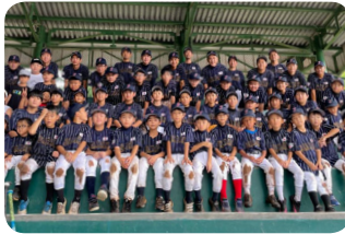
JJC Little League Baseball Club