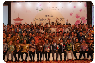
JJC Corporate New Year Party