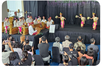
JJC Fujimatsuri (Festival)