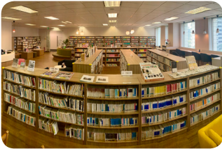
JJC Senayan Center (Library & Cafe)