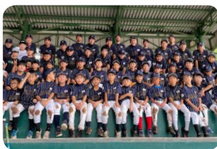
JJC Little League Baseball Club