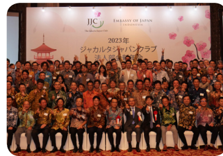
JJC Corporate New Year Party