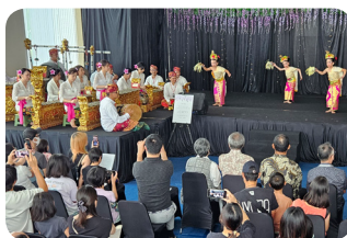
JJC Fujimatsuri (Festival)