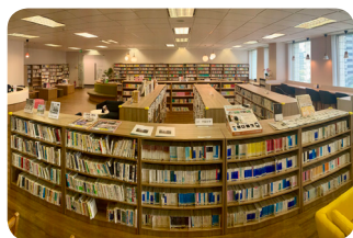
JJC Senayan Center (Library & Cafe)