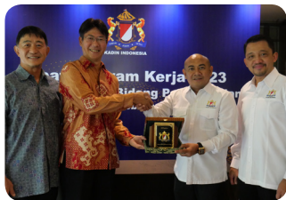
MoU with KADIN (HRD Committee)