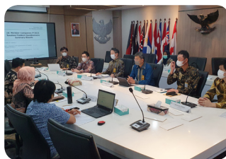
Discussion with DGT (Taxation Committee)