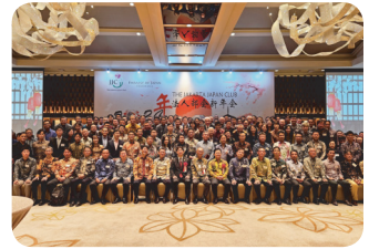
JJC Corporate New Year Party