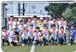
JJC Junior Soccer Club