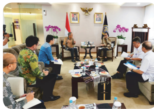
Discussion with Minister of Transportation