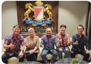
MoU with KADIN (HRD Committee)