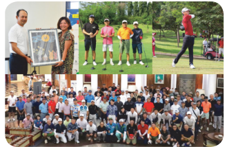
JJC Golf Events